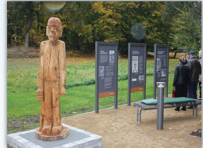
Neuer „Erinnerungspunkt“ (2016) beim ehemaligen Lager I Börgermoor

Seminar in Zusammenarbeit mit der Interessengemeinschaft niedersächsischer Gedenkstätten und Initiativen zur Erinnerung an die NS-Verbrechen